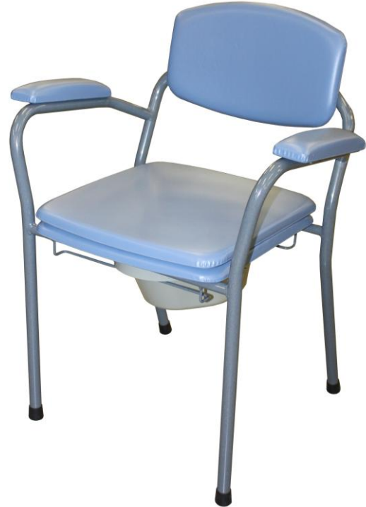
Modèle présenté : CANDY 155 GRIS PASTEL / BLEU - 2010042S1

Code identification individuelle LPPR : 6259207 (CHAISE PERCEE AVEC ACCOUDOIRS ET SEAU, VILGO)