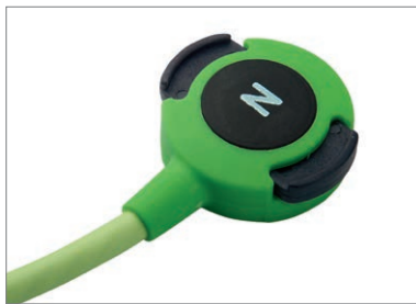
Clips de fermeture brevetés Z-Snap™