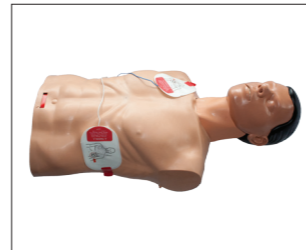
Placement des patches DAE