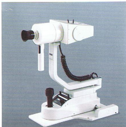
Ophthalmometer CL 110 auf Instrumentenbasis 20 SL

Die Ausrüstungsvarianten Ophthalmometer CL 110 auf Basis SL 105, 120/160 mit Schnellstoppeinrichtung ermöglichen eine Kombination des Ophthalmometers CL 110 mit den Spaltlampen SL 105, SL 120 und SL 160. Weiterhin ist der bewährte Einsatz des Ophthalmometers CL 110 auf Instrumentenbasis 20 SL möglich.