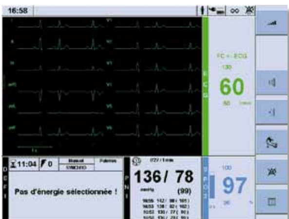
Affichage simultané des 12 dérivations ECG