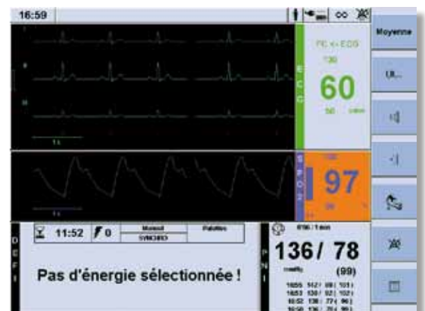
Affichage du plétysmogramme